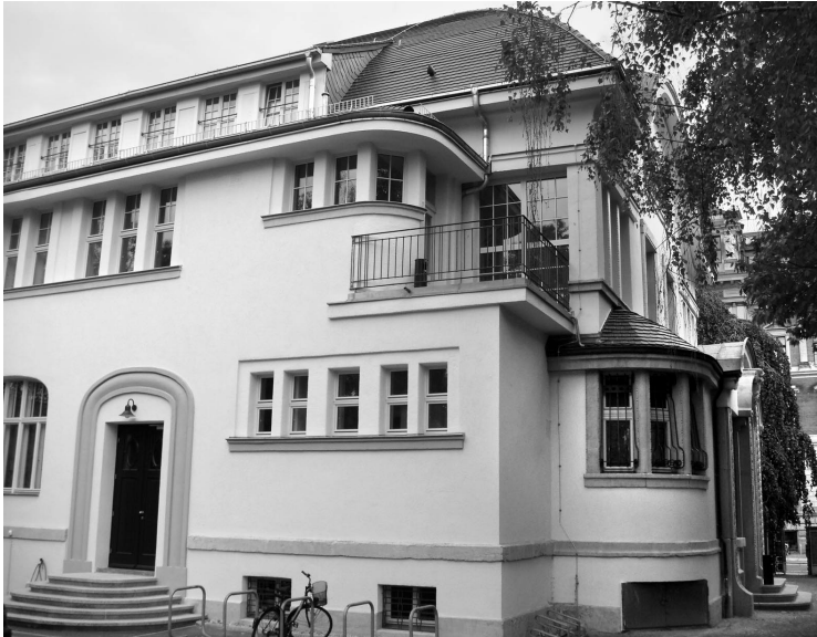
Deutsches Literatur- institut Leipzig, Wächterstraße 34, 2008

Das Haus – das ehemalige Gästehaus der DDR-Volkspolizei – war noch im Zustand seiner vormaligen Nutzung. Im Keller gab es eine Bar mit Tanzfläche, eine Sauna und eine Bauernstube mit Elektrokamin. In einer Kammer hingen die Reste der Abhöranlage aus der Wand. Auch bei diesem Haus war noch die Eigentumsfrage zu klären. Eine Erbengemeinschaft hatte Restitutionsansprüche. Ihr wurde von der Stadt Leipzig das Eigentum rückübertragen, danach wurde es vom Freistaat Sachsen um 5,5 Millionen DM erworben.