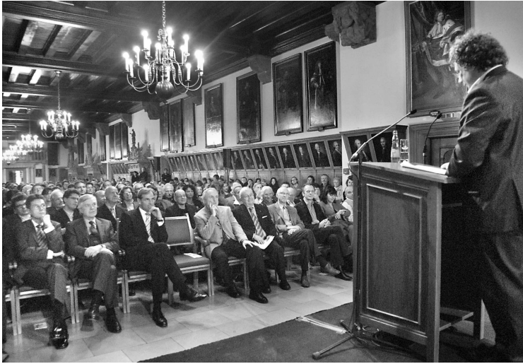
Erste Poetikvorlesung im Festsaal des Alten Rathauses, 31. Oktober 2007